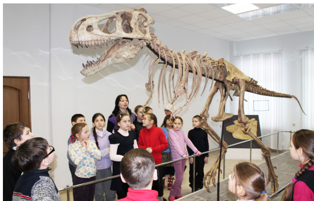
Экскурсия для школьников 4 класса школы № 18 Excursion for schoolchildren of the 4th grade of school No. 18

today, tomorrow". The reports of the Museum staff on the history of the formation of natural science collections in the Komi Republic will be presented, topical issues of museum business in the modern context, the specifics of exhibition and exposition work with stone material, research work on the basis of the museum, and development prospects will be discussed.