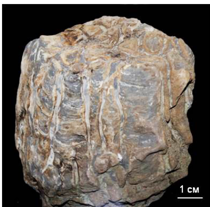
Строматолит. Рифей. Средний Тиман, р. Ворыква (муз. № 319/1-Антропова Е. В.) Stromatolite. Riphean. Middle Timan, Vorykva Riv. (mus. No. 319/1-Antropova E. V.)