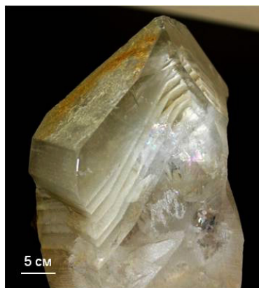
Кристалл горного хрусталя с зонами роста с месторождения Желанное (муз. № 666/896-Юхтанов П. П.) Rock crystal with growth zones from the Zhelannoye deposit (mus. No. 666/896-Yukhtanov P. P.)