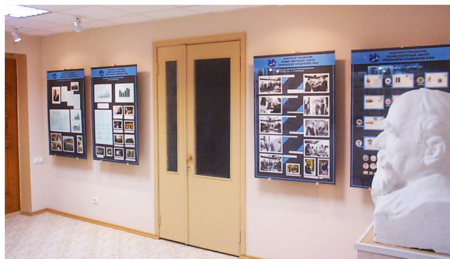
Геологический музей им. А. А. Чернова Института геологии A. A. Chernov Geological Museum of the Institute of Geology