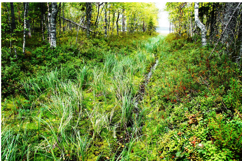
Рис. 2. Канал около деревни Шапповаара. Вид с севера. 2015 год. Fig. 2. The channel near the village of Schappovaara. View from the north. 2015.