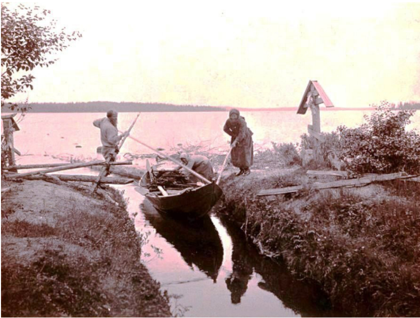
Рис. 4. Канал около деревни Шапповаара. 1894 год. Fig. 4. The channel near the village of Schappovaara. 1894.

Расположение не одного, а двух поклонных крестов по обеим сторонам южного входа в канал указывает на сакральное восприятие этого сооружения. В Карелии нам пока известен только один подобный случай двустороннего крестного замыкания вод – на восточном берегу Ладожского озера в устье р. Сяндебка (Олонецкий район Республики Карелия) 9 . К вопросу об оберегающей функции крестов, установленных по двум сторонам канала, можно вспомнить легенду, записанную на юге Олонецкой губернии в начале XX в. Согласно ей, строительству канала противился «водяник», засыпавший по ночам выкопанную крестьянами канаву, и только погружение креста в воду смогло его успокоить [19, с. 3].