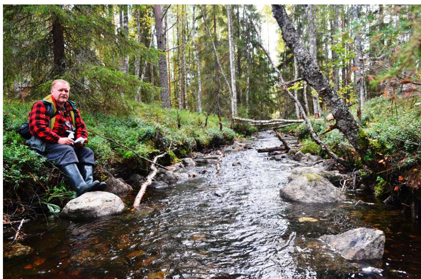
Рис. 6. Канал около деревни Лужмагуба. Вид с севера. 2015 г. Fig. 6. The canal near the village of Luzhmaguba. View from the north. 2015.

Работы по изучению крестьянских каналов Карелии только начались и сегодня у нас есть точные сведения всего о трех объектах, находящихся в Северном Беломорье, Заонежье и южнокарельском Приграничье. В 2017 г. экспедицией НМРК в северо-восточной части оз. Лоймолонъярви (Суоярвский район Республики Карелия) зафиксирован канал, пере-