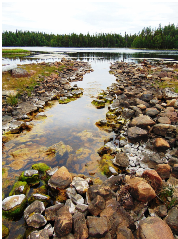
Рис. 8. Канал около деревни Порья Губа. Вид с севера. 2017 год. Fig. 8. The channel near the village of Porya Guba. View from the north. 2017.