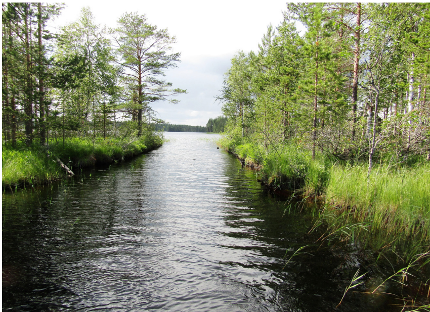
Рис. 7. Канал на озере Лоймолонярви. Вид с востока. 2017 год Fig. 7. The channel on Lake Loimolonyarvi. View from the east. 2017.

Археологические работы 2015 г. в заповеднике «Костомукшский» позволили обнаружить оригинальные, хорошей сохранности, исторические объекты культурного наследия – гидротехнические сооружения Нового времени.