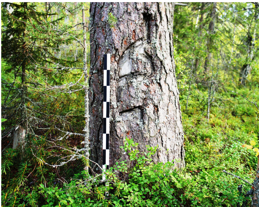
Рис. 3. Карсикко около канала у деревни Шапповаара. Вид с запада. 2015 год. Fig. 3. Karsikko near the channel near the village of Schappovaara. 2015. View from the west.

графии К. И. Инха кресты около канала старообрядческие, восьмиконечные, «под крышкой», грубо сколоченные. Они вкопаны в песок без укрепления основания камнями или срубом. Оба креста лицевыми сторонами преднамеренно обращены в сторону канала. Поэтому у восточного креста средняя перекладина располагается по православным правилам – ее северный конец выше южного, а у западного – наоборот. К крестам привязаны традиционные приношения – ленты белой материи – tuulipaikat ( tuuli – «ветер», paikka – «платок»). Возможно, что кресты стояли и в северной части канала, не запечатленной К.И. Инха. При датировании объекта нужно учитывать, что они могли быть поставлены не одновременно с открытием канала, а в любой период его существования.