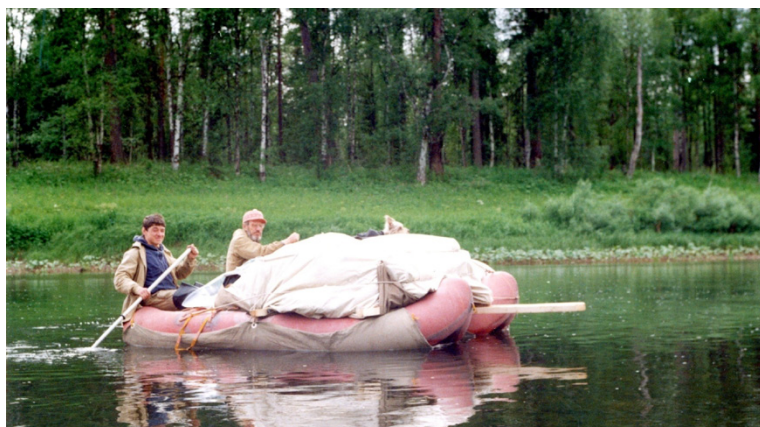
Сплав по реке Пижма, Средний Тиман, 1997 г. Rafting on the Pizhma River, Middle Timan, 1997