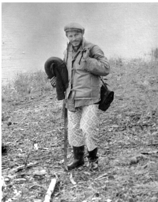
Дождливое поле на р. Щугор, 1963 г.

During the rainy field work on the Shchugor River, 1963