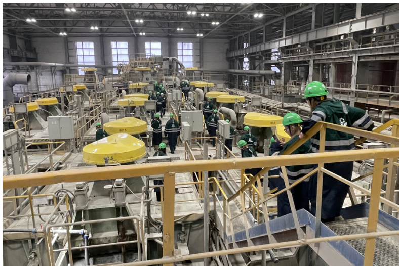
Опытно-промышленная обогатительная установка на территории Научно-исследовательского центра в Апатитах

• провести в 2025 году международную конференцию «Инновационные процессы комплексной и глубокой переработки природного и нетрадиционного минерального сырья» (Плаксинские чтения — 2025) на площадке Уральского государственного горного университета.