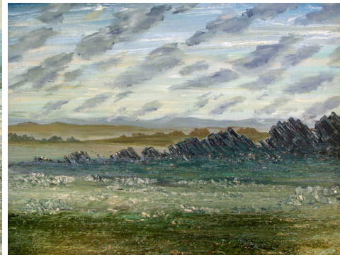
Асташев Сергей Семенович. Триптих «Пай-Хой одного дня» (Согласие. Равновесие. Соппротивление). 1977, 1991. Холст, масло Astashev Sergey Semyonovich. Pay-Khoy of One Day Triptych (Resistance. Equilibrium. Consent). 1977, 1991. Oil on canvas