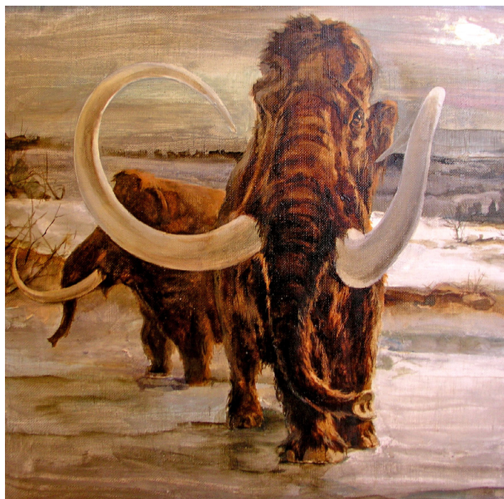
Павлюк Олег Иванович. Мамонты. Холст, масло Pavlyuk Oleg Ivanovich. Mammoths. Oil on canvas