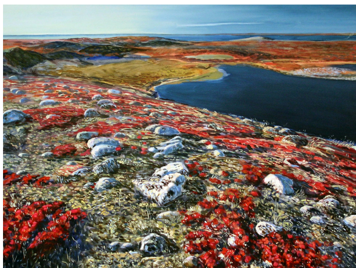
Иевлев А. Тундра. 2002. Холст, масло Ievlev A. Tundra. 2002. Oil on canvas