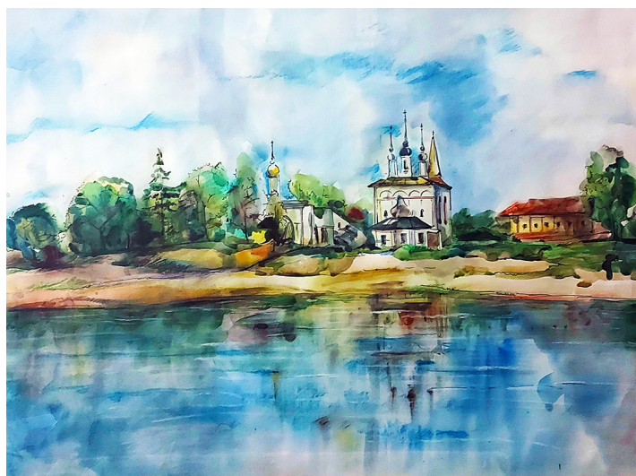
Автор неизвестен. Летний день. 2008. Бумага, акварель Unknown author. Summer day. 2008. Watercolor on paper