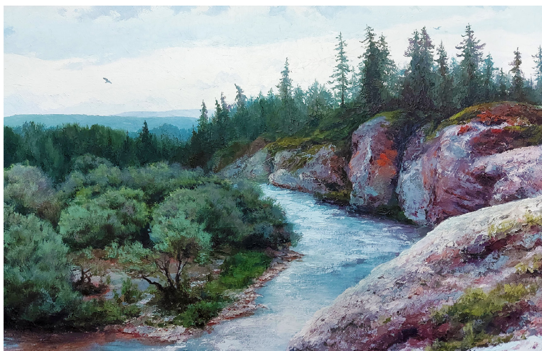
Бурцев Евгений Вячеславович. Река Балбан-Ю. 2015. Холст, масло Burtsev Evgeny Vyacheslavovich. Balban-Yu River. 2015. Oil on canvas

Бурцев Евгений Вячеславович Родился в 1982 г. Основы изобразительного искусства изучил в студии Ф. Ф. Анохина в г. Сыктывкаре