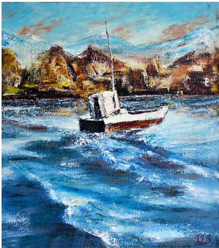
Попов П. В. Катер «Дора». 1995 Popov P. V. «Dora» boat. 1995