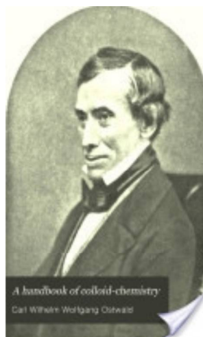
Рис. 1. В. Оствальд (1883—1943)

Даже химики, не говоря о других специалистах, мало знают биографию В. Оствальда, имя которого не-