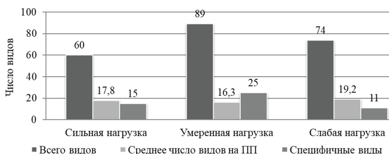
Рисунок 2. Общее число видов, среднее число видов на ПП и число специфических видов лишайников в сосновых лесах, испытывающих разную степень антропогенной нагрузки. Figure 2. Total number of species, mean number of species per sample plot, and number of specific species suffering from different recreational load.

Как уже отмечено выше, часть собранного материала не удалось определить до вида, в отдельных случаях и